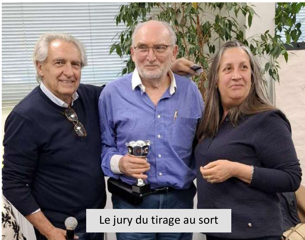
Le jury du tirage au sort