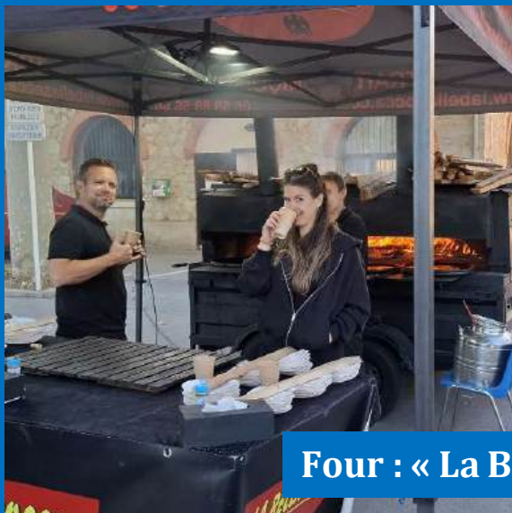
Four : « La Bella Socca » Nice