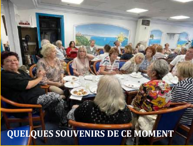
QUELQUES SOUVENIRS DE CE MOMENT