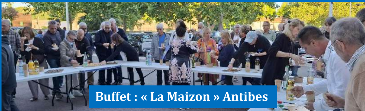
Buffet : « La Maizon » Antibes