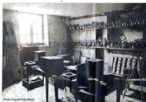
Un laboratoire de l'un des tout premiers photographes au monde vient d'être redécouvert

Suite à une mauvaise manipulation de l'opérateur, la totalité des photographies de l'AG 2025 ont été voilées et ne peuvent donc pas vous être présentées.